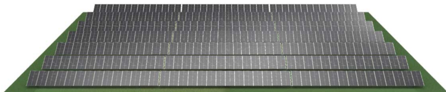
VIZUALIZACIJA - 3.