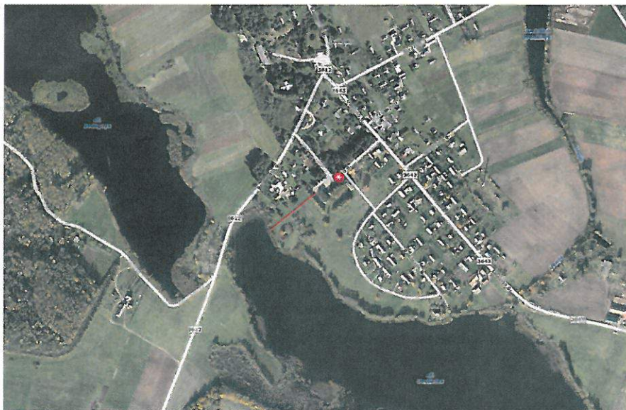
Schema Nr. 1

Gaisrinė sauga. Priešgaisriniai atstumai tarp pastatų numatomi pagal gaisrinės saugos pagrindinių reikalavimų 6 lentelę. Bendroju atveju planuojamų pastatų minimalus atsparumo ugniai laipsnis nustatomas – I, išlaikant atstumus tarp pastatų priklausomai nuo pastatų atsparumo ugniai. Techninio projekto rengimo metu turi būti tikslinamas pastatų atsparumo ugniai laipsnis. Projekte užtikrinamas priešgaisrinių automobilių privažiavimas prie kiekvieno projektuojamo sklypo. Gaisriniais automobiliams skirtų pravažiavimų aukštis turi būti ne mažesnis kaip 4,25 m, o plotis ne mažesnis kaip 3,5 m (visais atvejais – iki išsikišusių konstrukcijų). Gaisro plitimas į gretimus pastatus ribojamas užtikrinant saugius atstumus tarp pastatų lauko sienų.