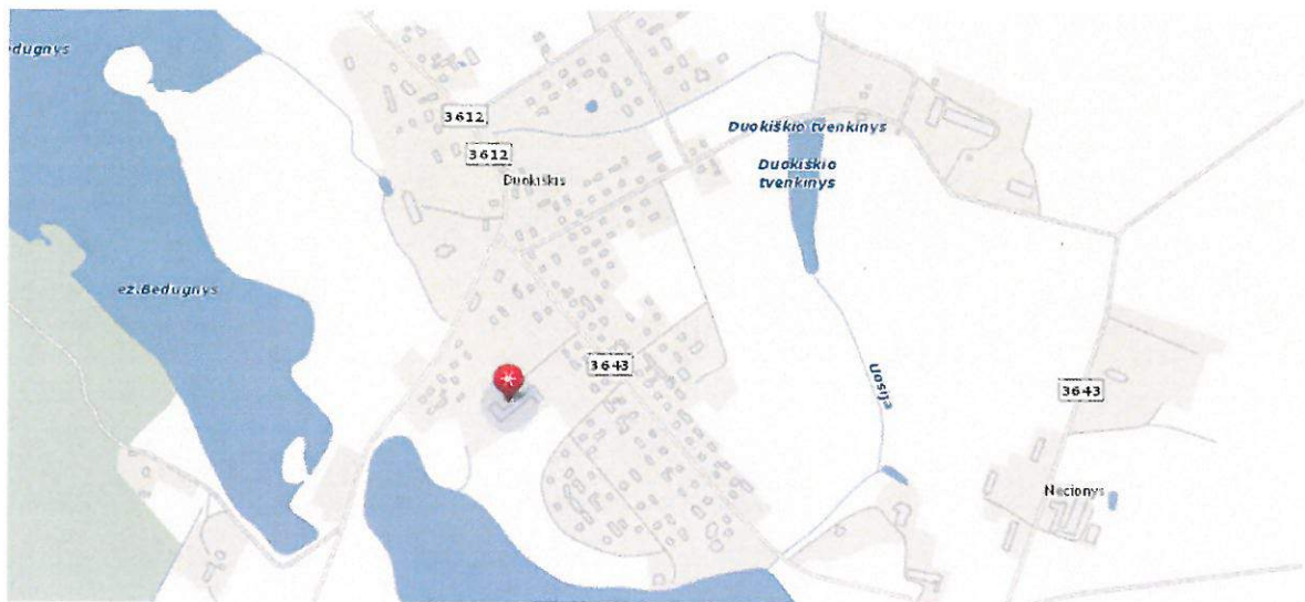
1 paveikslas. Planuojamos teritorijos padėtis vietovėje

1.3 PLANUOJAMA TERITORIJA: žemės sklypas, esantis Parko g. 1 (esantys kultūros namai), Duokiškio miestelyje, Kamajų seniūnijoje (žr. 1 pav.). Planuojamas sklypo plotas – 0,8 ha.