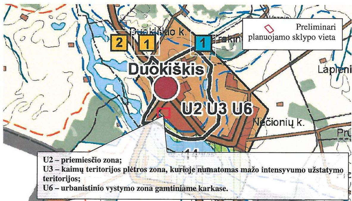
2 paveikslas. Ištrauka iš Rokiškio rajono savivaldybės bendrojo plano ties planuojama teritorija

Urbanistinė situacija. Esama teritorija (sklypo ribos nesuformuotos) yra Kamajų seniūnijoje, Duokiškio miestelyje, šalia Uostinto ir Bedugnio ežero, kurie yra už pietvakarinės miestelio ribos. Planuojamoje teritorijoje yra įsikūrę kultūros namai, todėl tai sąlygiškai svarbus Kamajų miestelio urbanistinis ir socialinis taškas. Miestelį kerta rajono kelias Nr. 3612 ir rajono kelias Nr. 3643. Šiaurės vakarinėje dalyje yra Duokiškio tvenkinys, į kurį įteka Uosijo upelis. Miestelyje yra įsikūrusi bendrojo lavinimo mokykla, biblioteka ir planuojamoje teritorijoje esantys kultūros namai. Šalia Duokiškio miestelio yra įsikūrę Nečionių, Vaineikių, Trakinės kaimai. Už maždaug 2 km pietvakarinėje kryptyje yra Rokiškio rajono savivaldybės riba. Vartotojo sklypui elektros energija tiekama iš KT JŽ-509.